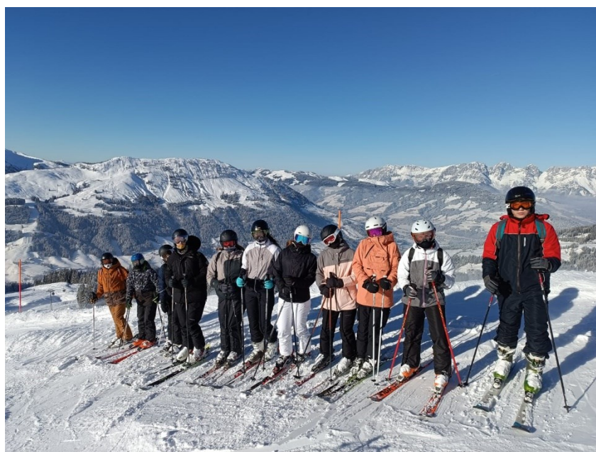
Obrázek 3 - Lyžařský kurz v Rakousku

Mezi nejvýznamnější patří odborné zahraniční stáže v rámci Erasmus+ : v tomto školním roce se uskutečnily v Irsku. Dále lyžařský kurz v rakouských Alpách a turistický kurz ve Švýcarsku . Nelze opomenout Veletřh fiktivních firem, projektové dny, čtenářské dílny, exkurze ve významných regionálních podnicích, přednášky odborníků z praxe, divadelní a filmová představení . Žáci s polským jazykem vyučovací absolvovali výjezd do Varšavy . Vybraní žáci se vydali za poznáním do Vídně . Významnou společenskou akcí je každoročně pořádaný Maturitní ples či slavnostní předávání maturitních vysvědčení. Podrobný přehled všech akcí lze najít v příloze.