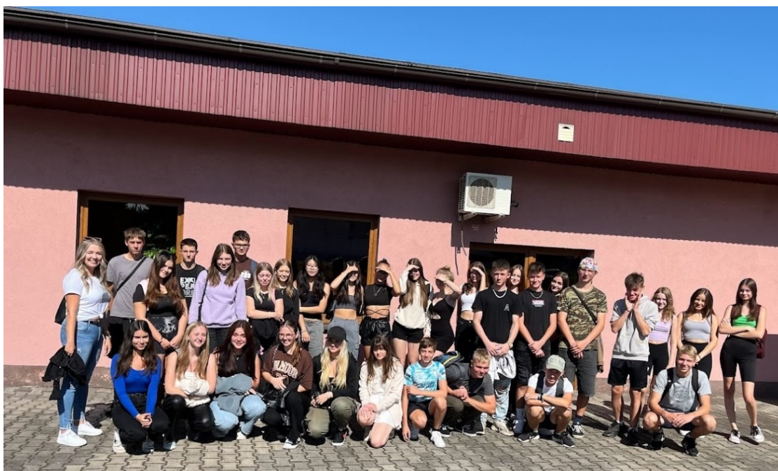
Obrázek 2 - Adaptační kurz – první společné foto třídy 1. B

Adaptační kurz pro žáky 1. ročníků byl cvičením sociálních schopností (schopnosti komunikovat, diskutovat, pracovat v týmu apod.). Kurz byl třídní, jednotlivé aktivity proběhly v prostorách školy a jejím okolí (aktivity s třídním učitelem v novém třídním kolektivu, dopoledne na bowlingu).