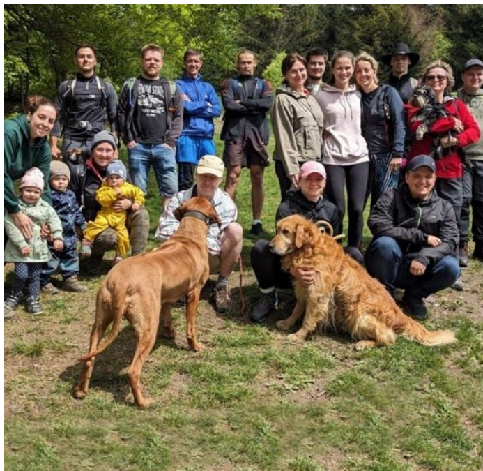
Obrázek 5 - Akce sportovního klubu