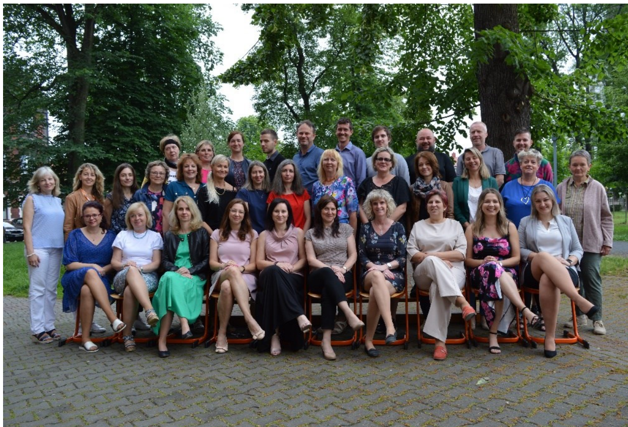
Obrázek 1 - Zaměstnanci školy