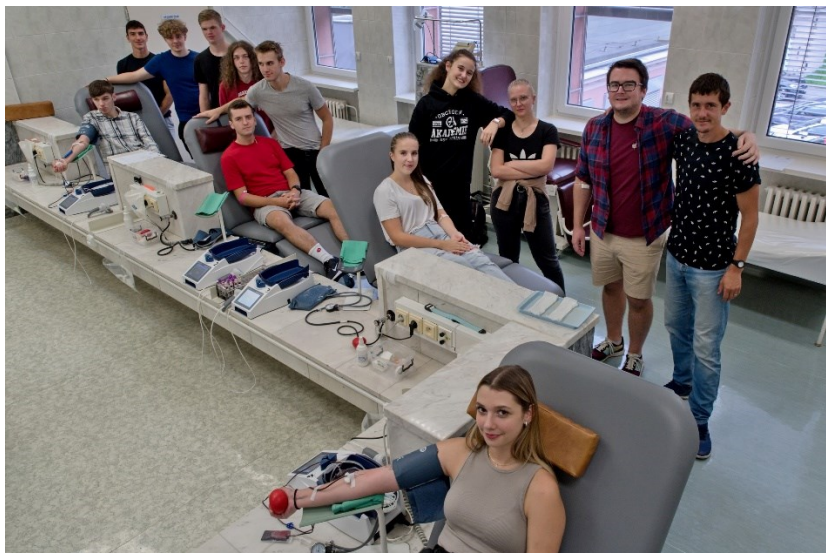
Obrázek 6 - Společné darování krve v karvinské nemocnici

Akce Studentské rady – Pečeme pro dobrou věc – výtěžek z této akce byl darován pro potřeby dětí z MŠ Slezské diakonie v Českém Těšíně.