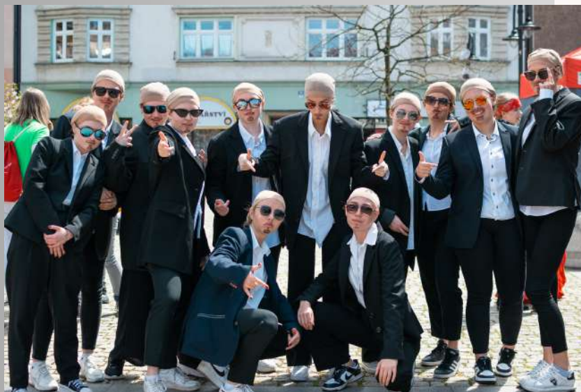
PITBULOVÉ z 3.B