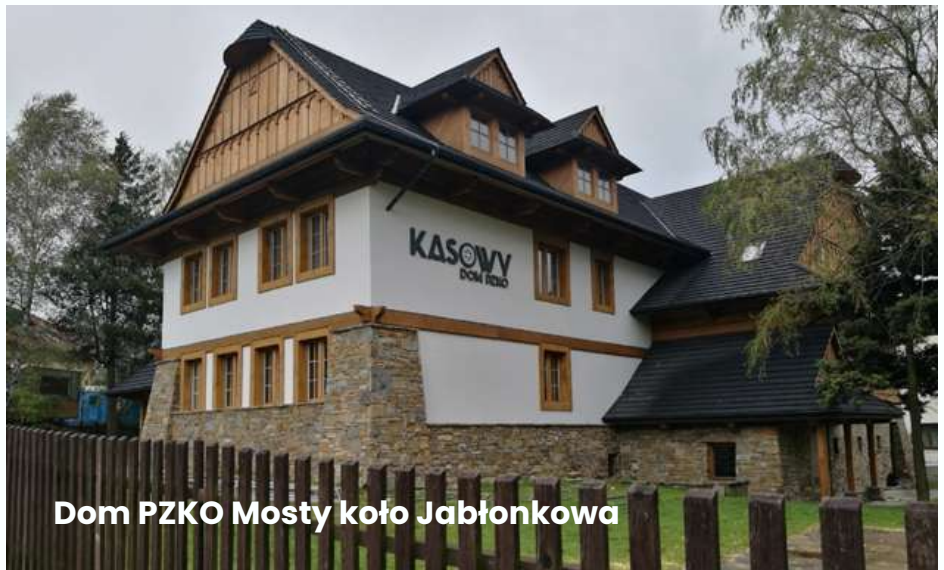
Dom PZKO Mosty koło Jablonkova

Za swoją działalność PZKO zostało uhonorowane kilkoma nagrodami, m.in. Nagrodą im. Wojciecha Korfantego nadaną w 2001 przez Związek Górnośląski za osiągnięcia i zasługi w pielęgnacji polskości na Śląsku, natomiast w 2006 – Nagrodą im. ks. Leopolda Jana Szersznika.