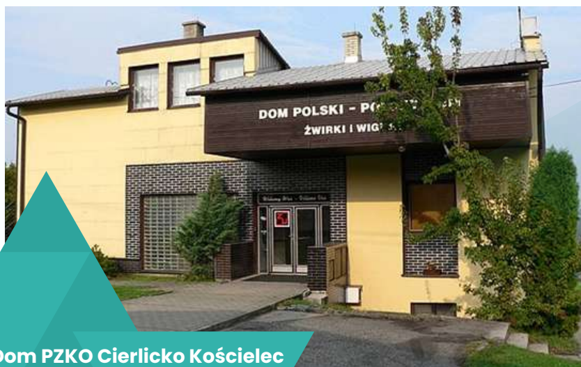
Dom PZKO Cierlicko Kościelec